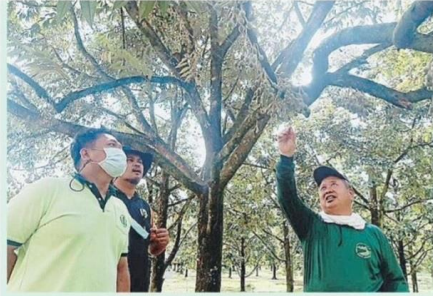
ให้ใช้ไฟแสงขาวไล่ผีเสื้อหนอนเจาะเมล็ดทุเรียน พร้อมกับ ท่อผลทุเรียนโดยใช้ถุงพลาสติกสีขาวขุ่น เจาะรูที่บริเวณ