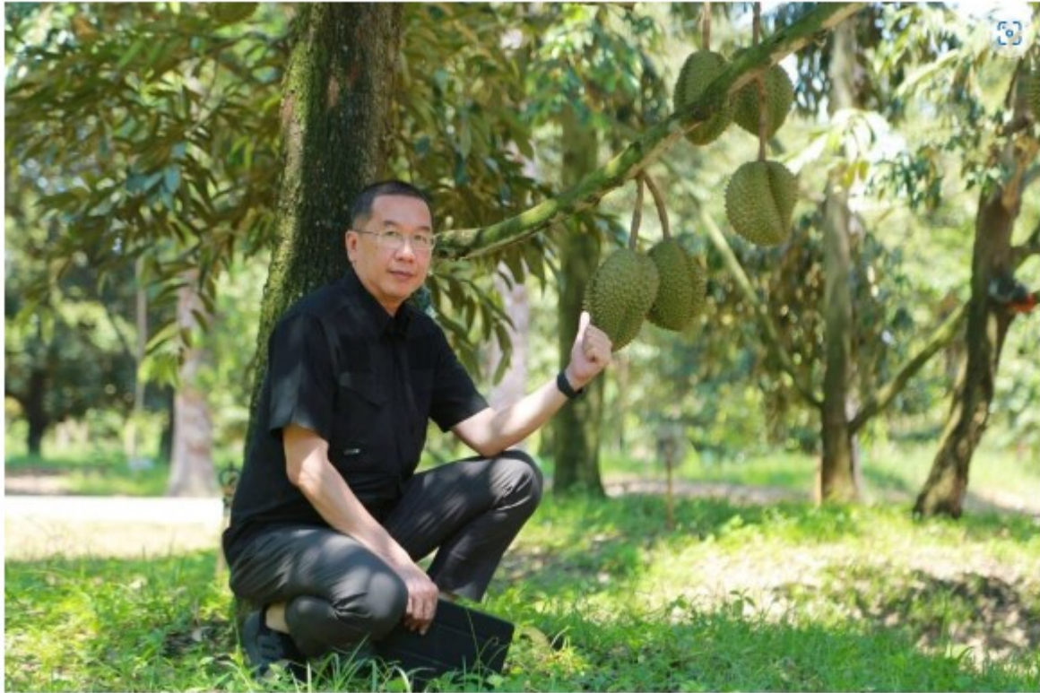
นายพิรพันธ์ คอทอง อธิบดีกรมส่งเสริมการเกษตร

โดยการส่งออกในปีที่แล้วมีอัตราการเติบโตอยู่ประมาณ 8% คาดว่าปีนี้จะสามารถส่งออกเพิ่มขึ้นไปได้ถึง 1 ล้านตัน คิดเป็นมูลค่าไม่น้อยกว่า 1.4 แสนล้านบาท ซึ่งกรมส่งเสริมการเกษตรมีมาตรการป้องกันควบคุมคุณภาพ โดยบูรณาการทำงานร่วมกับทุกหน่วยงาน ในส่วนของการจัดการช่วงต้นทาง มีมาตรการตรวจก่อนตัดเพื่อตรวจวัดเปอร์เซ็นต์น้ำหนักแห้งของเนื้อทุเรียน ซึ่งเกษตรกรจะนำผลทุเรียนตัวอย่างมารับบริการที่จุดบริการตรวจก่อนตัด ณ สำนักงานเกษตรอำเภอและจุดให้บริการอื่นที่กำหนด