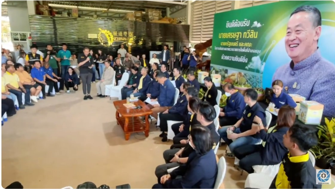
LIVE: นายกฯ ตรวจติดตามการผลิตทุเรียนคุณภาพปลอดภัยมูลค่าสูง ที่สวนนวลจันทร์ จ.จันทบุรี