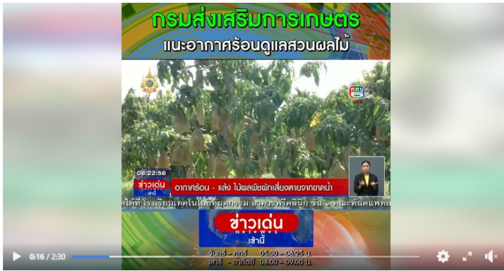
อากาศร้อน-แล้ง ไม้ผลพืชผักเสี่ยงตายจากการขาดน้ำ กรมส่งเสริมการเกษตร และอากาศร้อนดูแลสวนผลไม้ Youtube : https://www.youtube.com/watch...