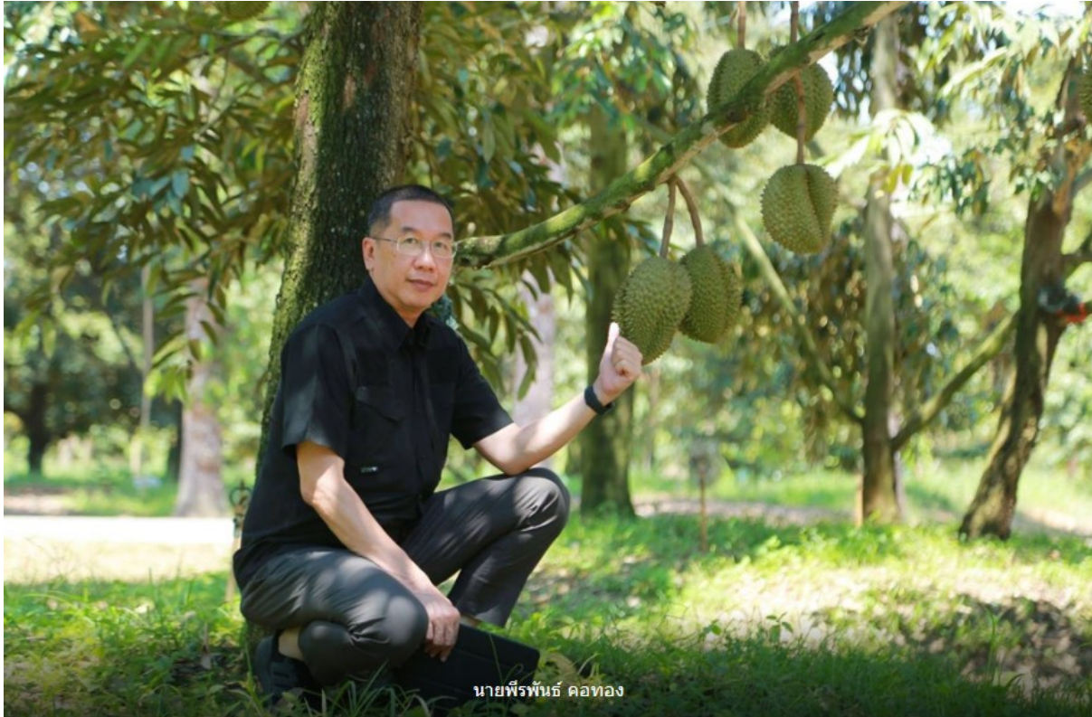
นายพีรพันธ์ คอทอง

ด้าน นายพีรพันธ์ คอทอง อธิบดีกรมส่งเสริมการเกษตร ได้รายงานสถานการณ์การปลูกทุเรียนของภาคตะวันออก ปี 2567 ว่า มีเนื้อที่ยืนต้นรวม 687,140 ไร่ เนื้อที่ให้ผลผลิตแล้วรวม 424,724 ไร่ ปริมาณผลผลิตรวม 782,874 ตัน ผลผลิตเฉลี่ยต่อไร่อยู่ที่ประมาณ 1.8 – 2.5 ตันต่อไร่ ซึ่งจะทำให้ Net Profit Margin อยู่ที่ประมาณ 50 – 60 เปอร์เซ็นต์ โดยการส่งออกในปีที่แล้วมีอัตราการเติบโตอยู่ประมาณ 8% คาดว่าปีนี้จะสามารถส่งออกเพิ่มขึ้นไปได้ถึง 1 ล้านตัน คิดเป็นมูลค่าไม่น้อยกว่า 1.4 แสนล้านบาท ซึ่งกรมส่งเสริมการเกษตรมีมาตรการป้องกันควบคุมคุณภาพ โดยบูรณาการทำงานร่วมกับทุกหน่วยงาน ในส่วนของการจัดการช่วงต้นทาง มีมาตรการตรวจก่อนตัดเพื่อตรวจวัดเปอร์เซ็นต์น้ำหนักแห้งของเนื้อทุเรียน ซึ่งเกษตรกรจะนำผลทุเรียนตัวอย่างมารับบริการที่จุดบริการตรวจก่อนตัด ณ สำนักงานเกษตรอำเภอและจุดให้บริการอื่นที่กำหนด เมื่อผ่านเกณฑ์ที่กำหนดตามแต่ละสายพันธุ์ เจ้าหน้าที่จะออกใบรับรองเพื่อให้เกษตรกรนำไปแนบกับสำเนาใบรับรอง GAP และได้แนะนำให้เกษตรกรสลักด้านหลังสำเนาไว้ทุกครั้งว่าผลผลิตนั้นนำไปส่งที่ไหนอย่างไร เพื่อส่งไปยังแหล่งรวบรวมรับซื้อได้สอบถามที่รับและให้กรมวิชาการเกษตรได้ตรวจสอบกำกับ