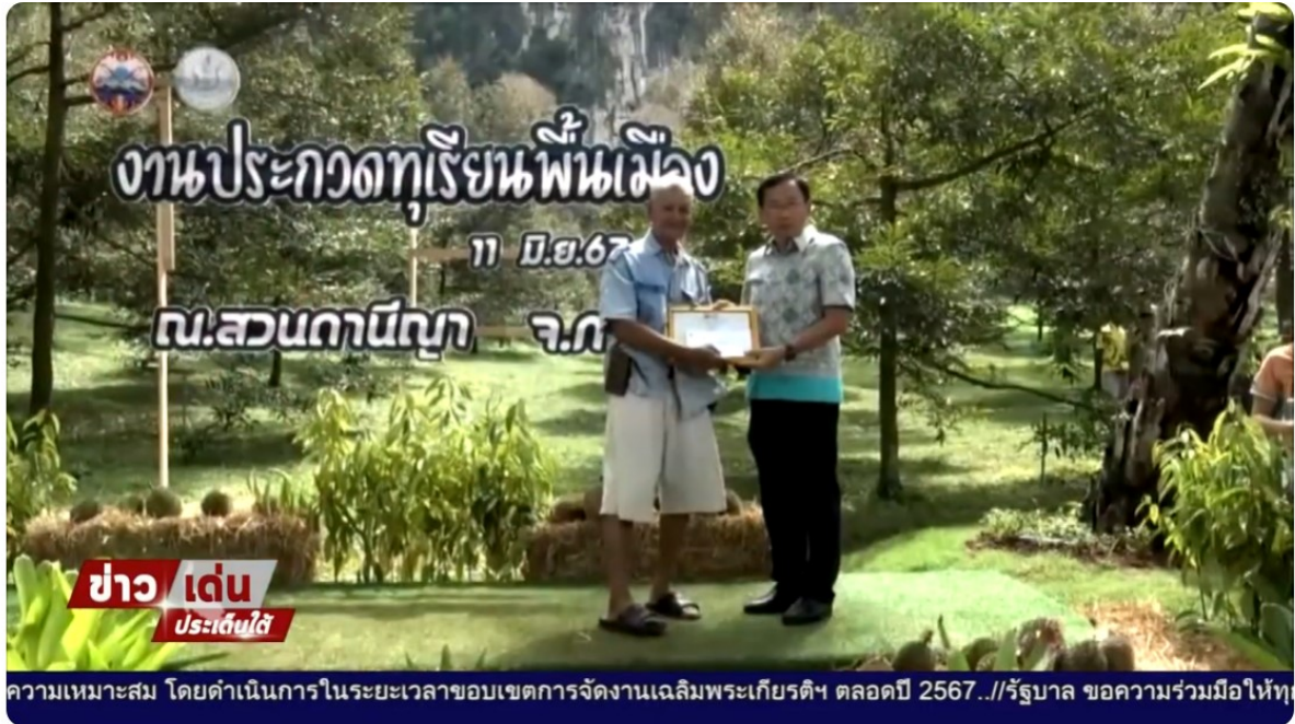
NBT South ช่อง 11 ดิจิทัล ข่าวเด่นประเด็นใต้ กระบี่ ประกวดทุเรียนพันธุ์พื้นเมืองพันธุ์ดี