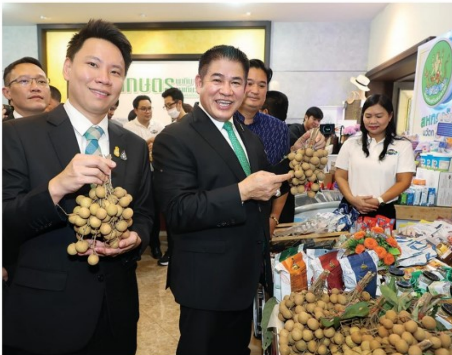
△ มหกรรมเกษตร - รมว.ธรรมนัส ทพทมนเฝ้า รมว.เกษตรและสหกรณ์ เยี่ยมชมผลผลิตระหว่างเป็นประธานแถลง จัดมหกรรม 'เกษตรพากิน พาทเที่ยว @ลานคนเมือง' งานมีขึ้นระหว่างวันที่ 26-30 มิ.ย. ที่ลานคนเมือง ศาลาว่าการกรุงเทพฯ

อัครลักษณ์ท้องถิ่นใจ 6 ประเภท 132 รายการ ทั้งข้าว-พืชผัก-ผลไม้-ชา-กาแฟ-ประมง-ปศุสัตว์-ผ้าไหม-สิ่งทอ-หัตถกรรม พบกับ นิทรรศการ-งานวิจัย-เวิร์กช็อปสร้างอาชีพ ส่งต่อผลงานครั้งนี้เป็นต้นแบบให้ทุกจังหวัดจัดอีก เล็งนำร่องที่พะเยากับเชียงใหม่ สร้างมูลค่า-รายได้ เปิดช่องทางขายสินค้า ให้เกษตรกร ขยายตลาดผ่านอีคอมเมิร์ซ