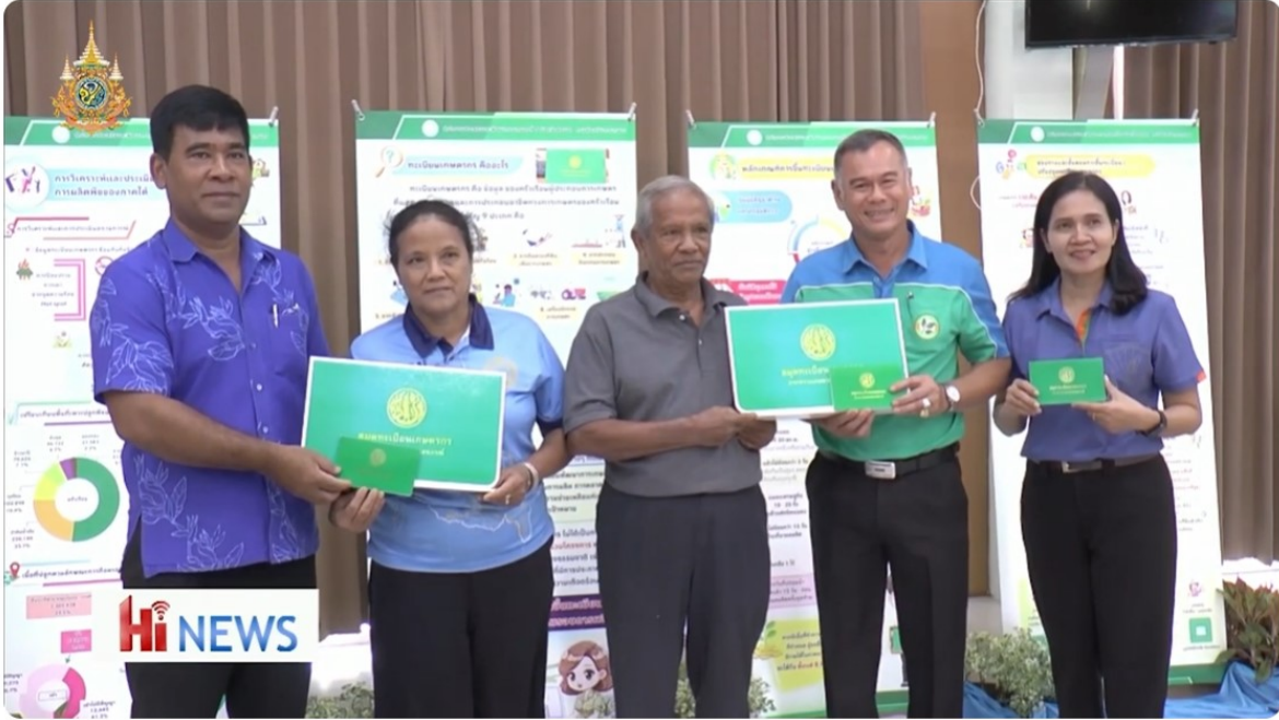
สำนักงานส่งเสริมและพัฒนาการเกษตรที่ 5 สงขลา Kick off “ขึ้นทะเบียนและปรับปรุงทะเบียนเกษตรกร”