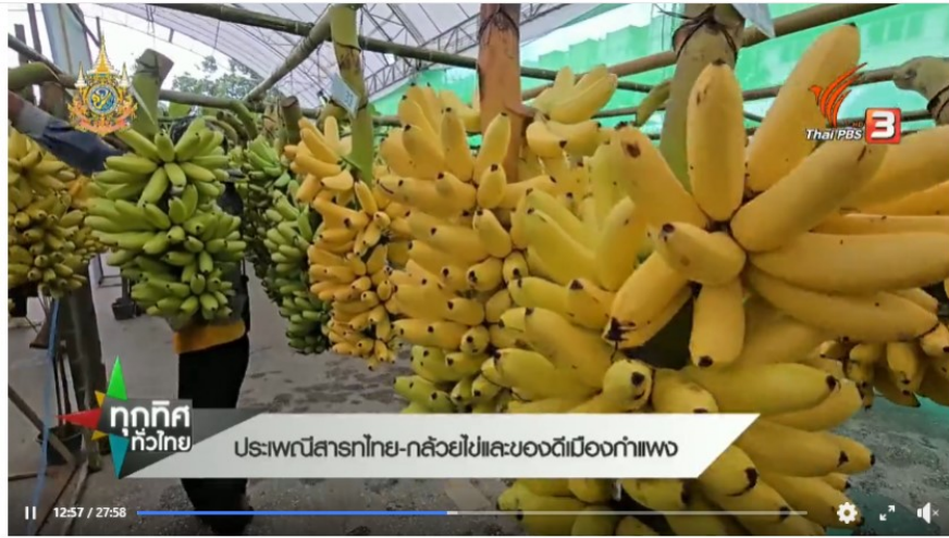
[Live] 15.30 น. #ทุกทิศทั่วไทย (30 ก.ย. 67)

Thai PBS was live. Yesterday at 01:30 [Live] 15.30 น. #ทุกทิศทั่วไทย (30 ก.ย. 67)... See more