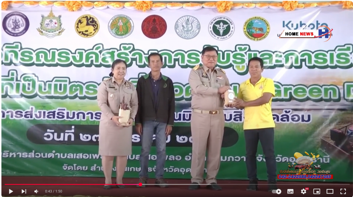
เกษตรจังหวัดอุดรธานีจัดเวทีสร้างการรับรู้ เรียนรู้เกษตรกรที่เป็นมิตรกับสิ่งแวดล้อม