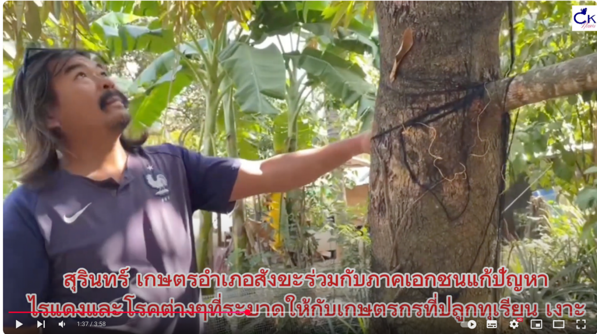
สุรินทร์ เกษตรอำเภอสังขะร่วมกับภาคเอกชนแก้ปัญหาไรแดงและโรคต่างๆที่ระบาด ให้กับเกษตรกรที่ปลูกทุเรียน