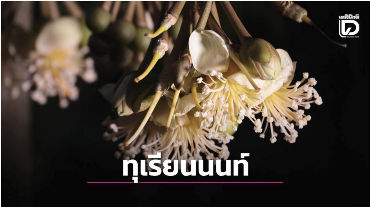
เกษตรกร จัดกิจกรรม “เปิดสวน ชวนปิดดอก” ทุเรียนเมืองนนท์ ปี 69 ส่งเสริมภูมิปัญญาท้องถิ่น ผสมเกสรทุเรียน ยกระดับการผลิตทุเรียนคุณภาพ

นางอัญชลี สุวจิตตานนท์ อธิบดีกรมส่งเสริมการเกษตร กล่าวว่า สถานการณ์ทุเรียนนนท์ ปัจจุบันมีพื้นที่ปลูกทุเรียนทั้งหมด 2,138.94 ไร่ เกษตรกร 1,277 ครัวเรือน ให้ผลผลิตรวมประมาณ 41.69 ตันต่อปี คิดเป็นมูลค่ากว่า 65 ล้านบาทต่อปี ซึ่งช่วงนี้ถือเป็นช่วงสำคัญสำหรับเกษตรกรชาวสวนทุเรียนนนท์ เนื่องจากทุเรียนกำลังเข้าสู่ช่วงระยะติดดอก มีผลต่อการกำหนดคุณภาพและผลผลิต เกษตรกรจึงมีการปิดดอกทุเรียน ซึ่งเป็นภูมิปัญญาดั้งเดิมของเกษตรกรชาวสวนทุเรียนนนท์ในการช่วยผสมเกสรทุเรียนด้วยมือ โดยใช้ไม้กวาดหรือพู่กันปิดเกสรตัวผู้ให้หล่นลงบนดอกเกสรตัวเมีย วิธีนี้จะทำให้การผสมเกสรสมบูรณ์มากขึ้น เปอร์เซ็นต์การติดผลสูงขึ้น ส่งผลให้รูปทรงของผลทุเรียนสวยงาม ไม่บิดเบี้ยว มีพุ่มมาก เป็นลักษณะเฉพาะของทุเรียนคุณภาพ ซึ่งภายหลังจากผสมเกสรแล้ว เกษตรกรจะบันทึกวันผสมเกสรไว้ทุกข้อ ทุกต้น เพื่อความแม่นยำในการตัดทุเรียน โดยปีนี้ผลผลิตทุเรียนนนท์จะเริ่มออกจำหน่ายตั้งแต่เดือนเมษายน 2569 เป็นต้นไป ใช้เวลา 90 – 120 วัน จากวันที่ทำการผสมเกสร เกษตรกรก็จะได้ทุเรียนสุกพอดี