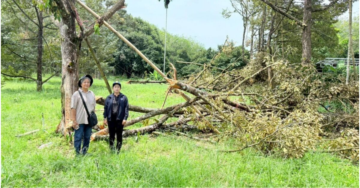
เกษตรกรฯ เผย 3 สิ่ง เกษตรกรควรทำ เพื่อรับการช่วยเหลือ เมื่อประสบภัยพิบัติด้านพืช

ปัจจุบันโลกกำลังเผชิญกับภาวะ “โลกรวน” ที่ส่งผลให้สภาพอากาศแปรปรวนรุนแรงและคาดการณ์ได้ยากทั้งฝนทิ้งช่วง น้ำท่วมฉับพลัน พายุฤดูร้อน อากาศร้อนจัด รวมถึงการระบาดของศัตรูพืชที่ส่งผลกระทบต่อภาคการเกษตรโดยตรง การรับมือภัยพิบัติด้านการเกษตรจึงไม่ใช่เพียงการเยียวยาหลังเกิดเหตุ แต่ต้องดำเนินการอย่างรอบด้าน ทั้งการเตรียมความพร้อม การลดความเสี่ยง การเฝ้าระวัง การฟื้นฟู และการสร้างภูมิคุ้มกันให้เกษตรกรสามารถปรับตัวได้อย่างยั่งยืน