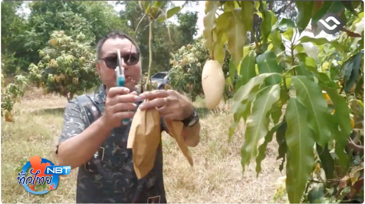
รายงาน แปลงสาธิตมะม่วงน้ำดอกไม้สู่การผลิต "มะม่วงนอกฤดู" NBT ทั่วไทย วันที่ 15 พฤษภาคม 2569 #NBT2HD